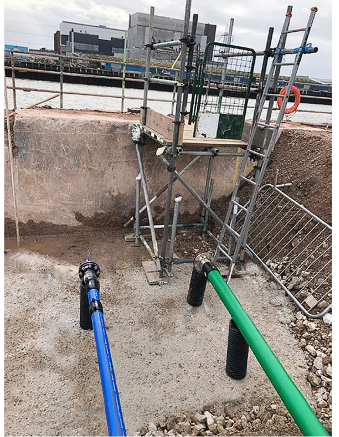
OPW tarafından kurum içi ve yerinde eğitim verildi