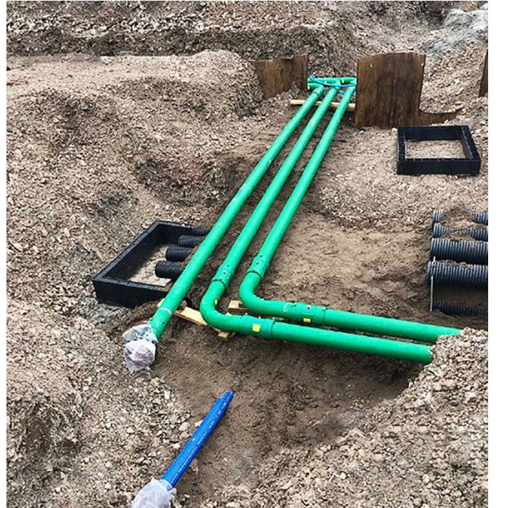
KPS double wall piping, allowing monitoring of interstitial space