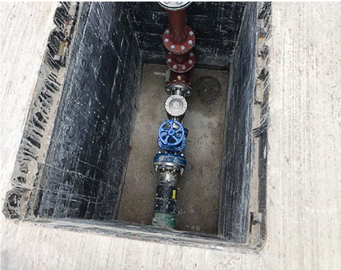
Yer altı uzaktan dolun noktasını tamamlar