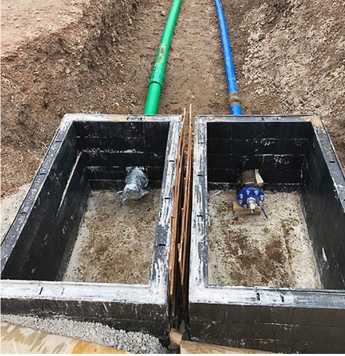
KPS boruları, sıfır geçirgenlik çözümü sağlar