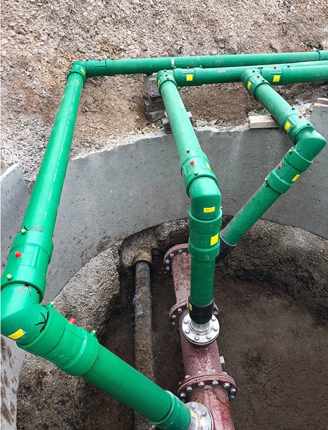
Kompakt kalıplanmış dirsekler, yeni KPS borularından daha önce inşa edilmiş olan yakıt borularına bağlantı sağlar

Müteahhit Eric Wright Waters, Lancashire' da (1904'te açıldı) bir eğlence ve ticari liman olan (3 milyon ton/yıl) Heysham Limanı' ndaki feribotlar için yeni çift cidarlı dizel dolun hatlarına tesisatçı dostu bir çözüm sağlamak üzere OPW'ye başvurdu.